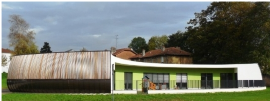
rue du Dr Edmond Morelle - Commercy (6670 habitants)

La nouvelle structure petite enfance aux formes organiques s'installe au sein d'un projet d'écoquartier. Cette silhouette sécurisante, tout en rondeurs, est propice à accueillir 35 enfants.