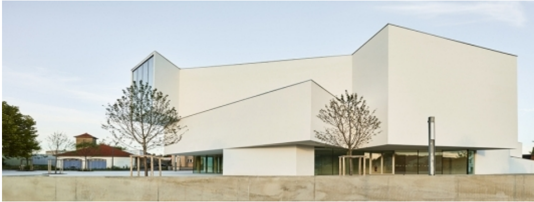
1 place des Alliés - Freyming-Merlebach (13523 habitants)

Ce projet, posé sur un socle, s'installe aux côtés de la nouvelle mairie et du centre commercial. Une salle de spectacle d'une jauge de 700 places assises, des espaces d'accueils ouverts pour les artistes et le public et des espaces logistiques composent ce bâtiment. Au dernier niveau, une grande baie vitrée cadre la vue sur la ville et ses collines. Sa silhouette épurée, composée de blocs blancs respecte l'échelle de la ville et donne un nouvel élan à un secteur en mutation.